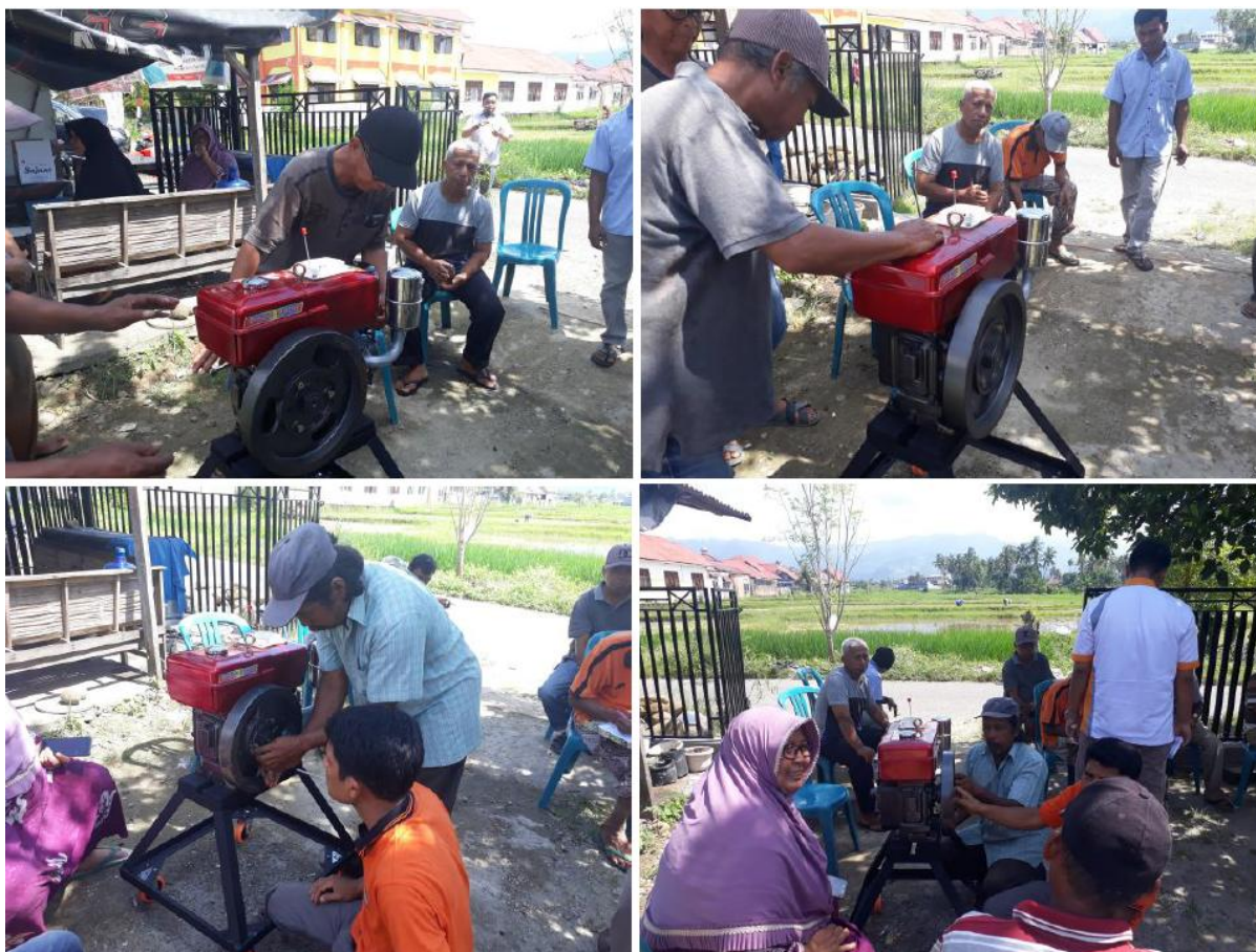
Gambar 4. Pelaksanaan materi pelatihan praktikum yang dilakukan anggota kelompok tani secara bergantian dan dibimbing oleh instruktur.