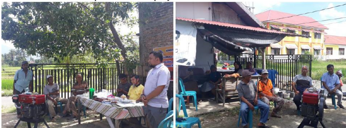
Gambar 3. Penyampaian materi teori pelatihan.