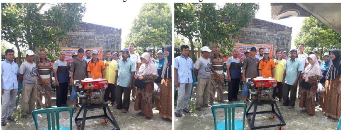
Gambar 5. Foto bersama setelah acara penutupan pelatihan.