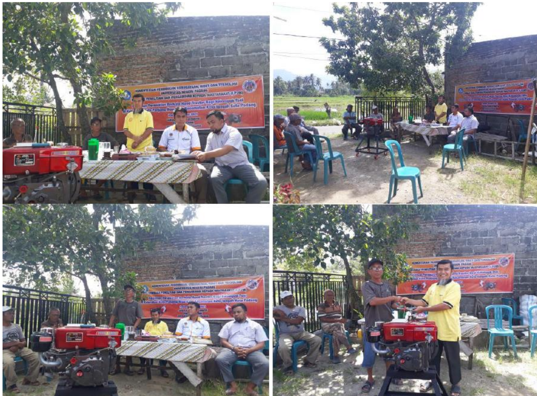
Gambar 2. Acara pembukaan dan penyerahan 1 unit mesin diesel hand tractor .