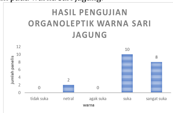
Grafik 2. Hasil data uji organoleptik dari warna sari jagung.

Hasil dari uji organoleptik warna sari jagung oleh panelis berbeda – beda, yaitu warna yang sangat disukai, suka, agak suka, netral, dan tidak suka, berikut adalah data hasil pengujian organoleptik pada warna sari jagung: