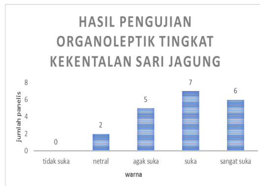
Grafik 6. Hasil data uji organoleptik dari tingkat kekentalan sari jagung.

Pada sari jagung ini mayoritas tingkat kekentalannya disukai oleh panelis dengan rerata 3,85.