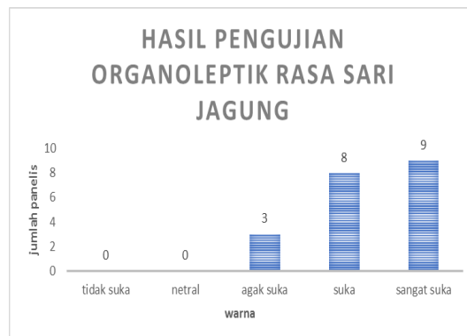
Grafik 4. Hasil data uji organoleptik dari rasa sari jagung.

Pada sari jagung ini mayoritas rasanya disukai oleh panelis dengan rerata 4,30.