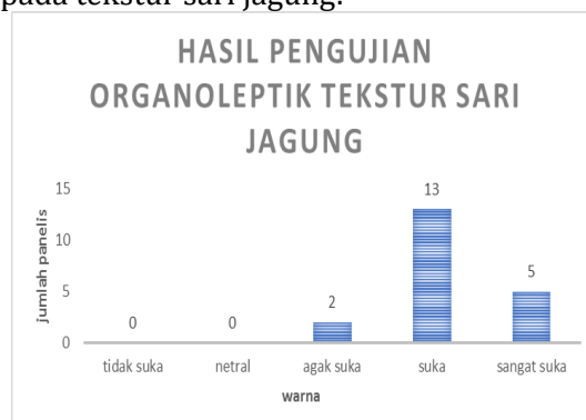
Grafik 3. Hasil data uji organoleptik dari tekstur sari jagung.

Hasil uji organoleptik tekstur sari jagung oleh panelis berbed–beda, yaitu tekstur yang sangat disukai, suka, agak suka, netral, dan tidak suka. berikut adalah data hasil pengujian organoleptik pada tekstur sari jagung: