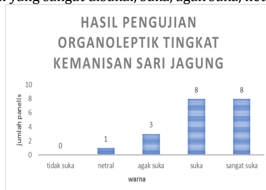
Grafik 5. Hasil data uji organoleptik dari tingkat kemanisan sari jagung.

Hasil uji organoleptik tingkat kemanisan sari jagung oleh panelis berbeda – beda, yaitu tingkat kemanisan yang sangat disukai, suka, agak suka, netral, dan tidak suka.