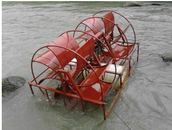
Gambar 6. Kincir Air Terapung yang direkayasa

pompa hanya 3,95 lpm (liter/menit) dengan efisiensinya sebesar 85%. Diperkirakan dalam 1 hari (24 jam) dapat menggerakkan sudu kincir sehingga kapasitas kerja pompa dapat mensuplai air sebesar 5,68 m 3 /hari air dapat dipindahkan ke sawah tadah hujan (Gambar 7).