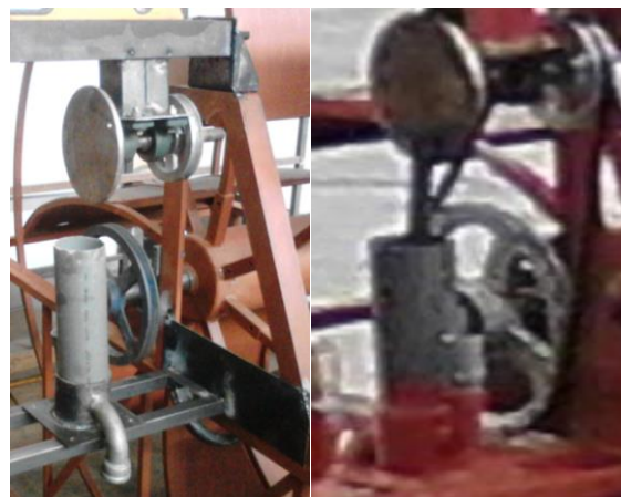
Gambar 5. Konstruksi pompa torak

Komponen kelengkapan kincir air terapung, di fabrikasi produksi dengan ukuran panjang 2 m dan lebar 2,6 m serta tinggi 0,75 m. Pada bagian samping kiri dan kanan dibangun berbentuk kotak persegi sebagai tempat peletakan konstruksi blade (sudu). Pada bagian tengah disediakan sebagai tempat peletakan drum plastik sebanyak 3 buah. Drum palstik yang digunakan berukuran diameter 0,65 m x 0,95 m yang berkapasitas 100 liter.