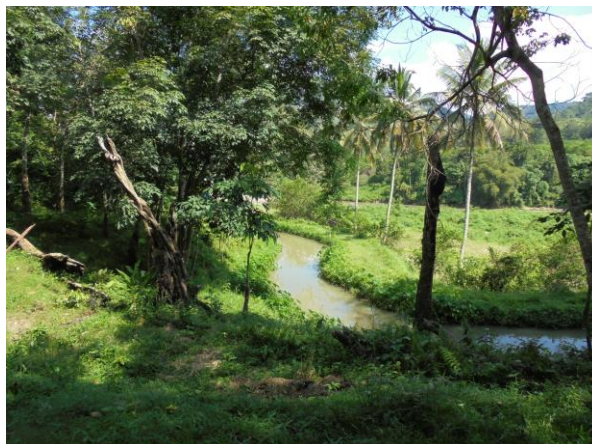
Gambar 1. Batang Air (Sungai) sebagai Sumber Potensi Energi

Namun dikarenakan sungai tersebut berada pada dataran rendah sehingga petak persawahan yang berada di dataran tinggi akan kesulitan air, sehingga air persawahan hanya diharapkan dari air hujan atau menyewa pompa untuk mensuplai air ke sawah. Untuk memompa dan menaikkan air dari sumber air (sungai) ke tempat areal persawahan pada dataran tinggi, masyarakat biasanya menggunakan pompa. Penggunaan pompa air ini masih mengalami kesulitan, antara lain tidak tersedianya sumber tenaga listrik atau sulitnya mendapatkan bahan bakar dan mahalnya biaya operasional pompa. Bagi petani yang kurang mampu biasanya mereka menyewa pompa orang lain dengan biaya Rp. 30.000/jam. Dalam sekali penggunaan penyewaan pompa air untuk mengairi satu petak persawahan ( \pm 1 hektar) dibutuhkan waktu selama 5 jam, sehingga masyarakat petani harus mengeluarkan biaya tambahan Rp. 150.000,-. Satu kali periode panen sawah pada musim kemarau dibutuhkan sebanyak 6 kali menyewa pompa air untuk satu petak persawahan. Sehingga pembiayaan modal petani untuk menghasilkan panen padi yang baik semakin bertambah besar dan kondisi ini menjadikan pendapatan para petani menjadi berkurang. Belum lagi ancaman yang masih dapat dimungkinkan untuk gagal panen. Bagi para petani yang tidak mempunyai modal pembiayaan, hal ini akan menjadikan sesuatu yang dapat berdampak langsung. Karena Cuma mengharapkan air dari pompa sehingga banyak petani tersebut gagal panen.