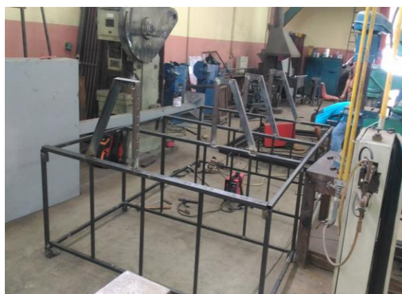
Gambar 3. Konstruksi kincir air

berdasarkan pekerjaan yang sudah direncanakan. Dari gambaran kegiatan yang diterapkan ke kelompok tani sebagai masyarakat mitra pengabdian masyarakat diperoleh berbagai kesepakatan dan komitmen bersama sebagai wujud realisasi program yang difasilitasi oleh pihak pemuka masyarakat dan perangkat nagari terkait di Nagari Rajo Dani Padang Ganting. Penerapan ipteks yang dilaksanakan yaitu Rancang Bangun alat berupa kincir air terapung untuk menggerakkan pompa. Kincir air poros vertikal dianggap menyederhanakan sistem transmisi di mana energi mekanik dapat langsung terhubung ke peralatan yang diinginkan ke perangkat seperti mesin penggilingan, pompa, dan sebagainya (Darmawi, Sipahutar, Bernas, & Imanuddin, 2013). Rekayasa kincir air terapung ini sebagai penyalur kebutuhan air persawahan tadah hujan masyarakat di Nagari Rajo Dani Padang Ganting. Air yang disuplai berasal dari sungai yang berada di bawah dari petak-petak persawahan masyarakat. Sistem dan mekanisme konstruksi kincir air yang dibangun menggunakan model penyambungan baut (sistem knok down ) sehingga mudah untuk pemasangan di lapangan (Gambar 3).