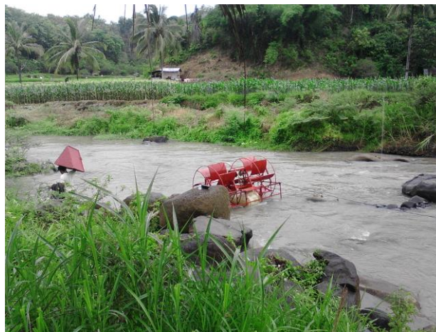
Gambar 7. Penerpan Kincir Air Terapung di sungai

Program kegiatan Ipteks bagi Masyarakat yang dilaksanakan berdampak positif terhadap masyarakat. Ketercapaian kegiatan ini tentunya selesainya kincir air terapung sampai pada kondisi terpasang di lapangan sehingga dapat dipergunakan oleh masyarakat mitra untuk menaikkan air ke sawah mereka yang berada di ketinggian. Hal ini terungkap dari penyampaian masyarakat dan perangkat nagari kepada tim pelaksana. Pandangan tersendiri bagi masyarakat dengan memanfaatkan teknologi yang diterapkan melalui kegiatan IbM. Masyarakat dapat menyelesaikan permasalahan yang terjadi khususnya dalam meningkatkan mengatasi kebutuhan air persawahan. dan pemahamannya melalui informasi yang disampaikan oleh tim pelaksana. Harapan berikutnya beberapa hal yang sudah diterapkan dapat digunakan dan dijaga serta dilaksanakan perawatannya oleh masyarakat dalam meningkatkan produktifitas masyarakat mitra dan Nagari Rajo Dani Padang Ganting.