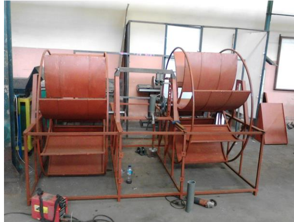
Gambar 4. Konstruksi sudu ( blade ) kincir

Komponen kelengkapan kincir air terapung, di fabrikasi produksi dengan ukuran panjang 2 m dan lebar 2,6 m serta tinggi 0,75 m. Pada bagian samping kiri dan kanan dibangun berbentuk kotak persegi sebagai tempat peletakan konstruksi blade (sudu). Pada bagian tengah disediakan sebagai tempat peletakan drum plastik sebanyak 3 buah. Drum palstik yang digunakan berukuran diameter 0,65 m x 0,95 m yang berkapasitas 100 liter.